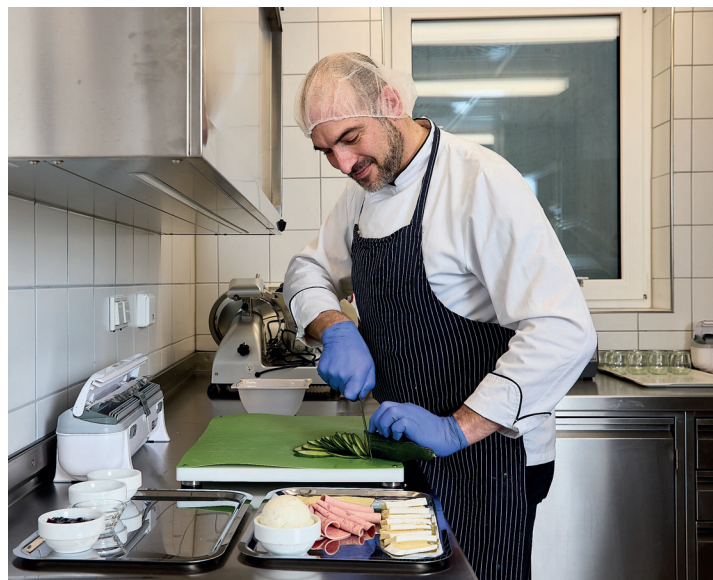
emeis-Pflegeeinrichtung, Rodgau - Deutschland, 2023